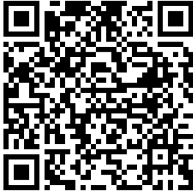
QR-Code Meldeplattform Asiatische Hornisse

Württemberg. Dies ist über die Meldeplattform auf der Homepage der Landesanstalt für Umwelt (LUBW), aber auch über die kostenlose „Meine Umwelt-App“ möglich: